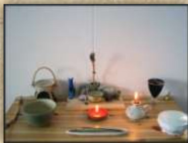
Domácí oltář se symboly indoevropské kosmologie - posvátným ohněm, studnou a světovým stromem.